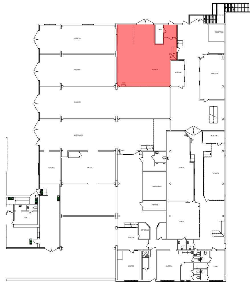
Del B - Bottenplan